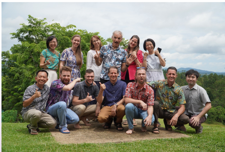
Onze mooie geweldige team