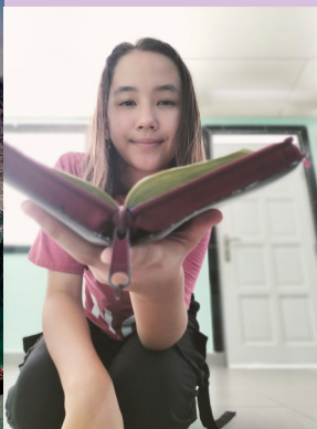
Bijbel vers voor deze maand