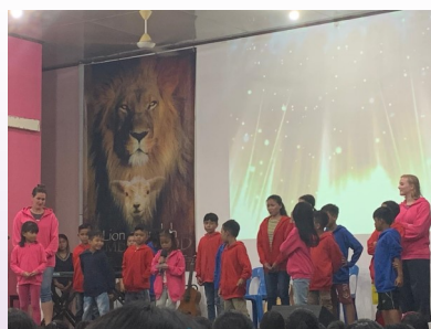
Dansje gedaan met mijn leesklasje

The Lord bless you and keep you; The Lord make His face shine upon you, and be gracious to you; The Lord lift up His countenance upon you. And give you Peace.